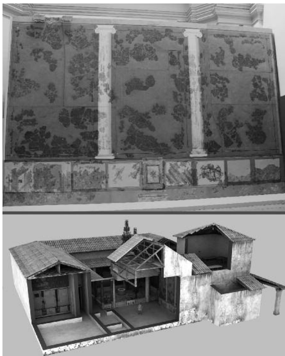
Fig. 3. Detalles de la casa de los Grifos: arriba, pintura mural del lienzo Oeste de la estancia E, una vez restaurada. Abajo, modelo tridimensional mostrando la hipótesis de anastilosis del edificio, desde el Norte.

3. La de atrio mediterráneo, inspirada en los modelos itálicos, sin ambulacra y con impluvium 9 . Dentro de este modelo diferenciamos tres subtipos en función de la localización del atrio: 3.1 atrio centralizado, 3.2 atrio trasero, 3.3 atrio lateral.