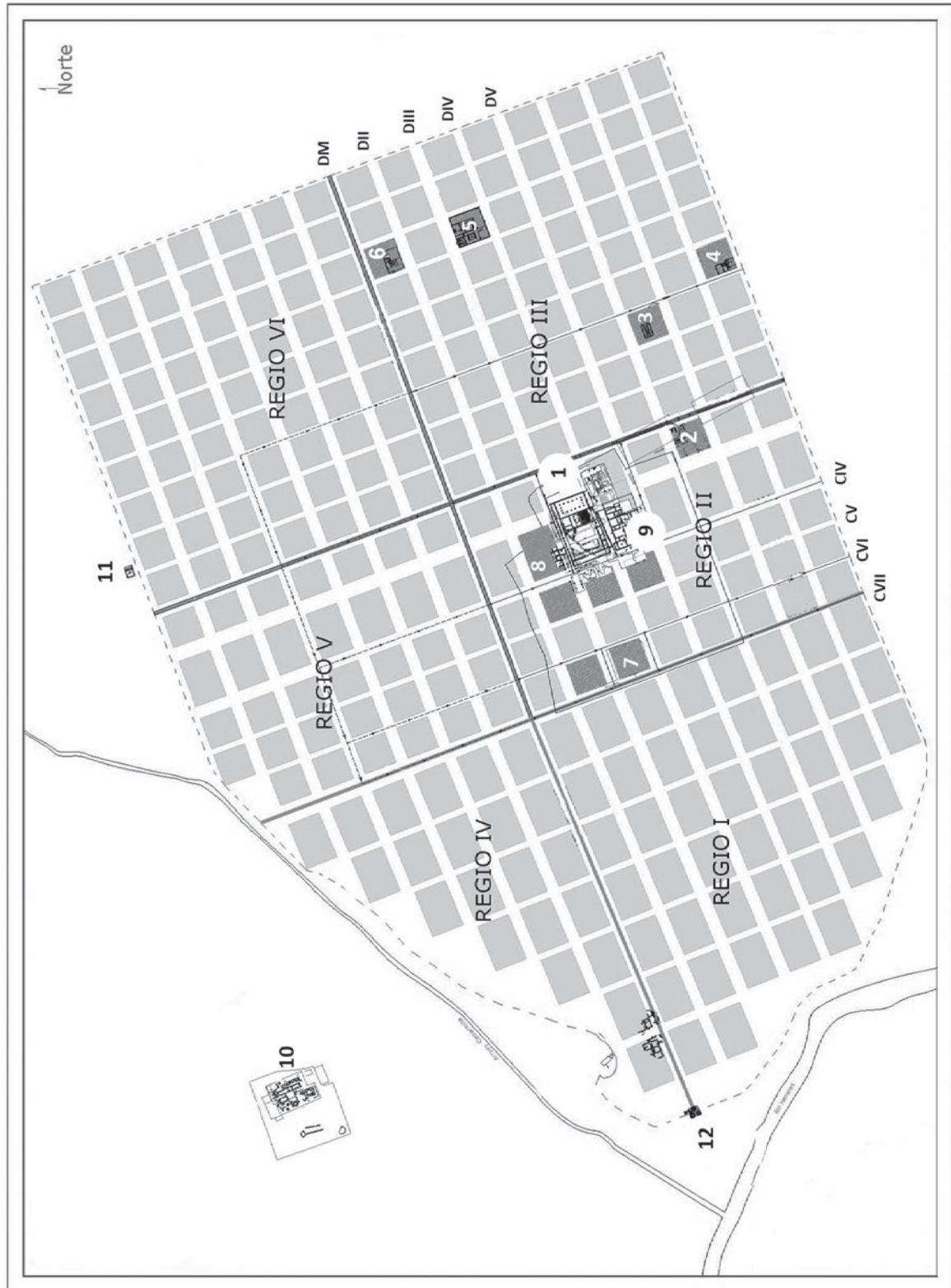
Fig.1.- Complutum , planta diacrónica de la ciudad romana con los principales elementos urbanos citados en este trabajo: 1, foro y edificios públicos; 2, casa de Leda; 3, casa de Cupidos II; 4, casa de los Peces; 5, casa de Baco; 6, casa de Cupidos; 7, casas del Atrio, de Marte y de la Máscara de la Lucerna Trágica; 8, casa de los Augures; 9, casa de los Grifos; 10, casa de Hippolytus ; 11, mausoleo de Aquiles; 12, arco cuadrifronte.