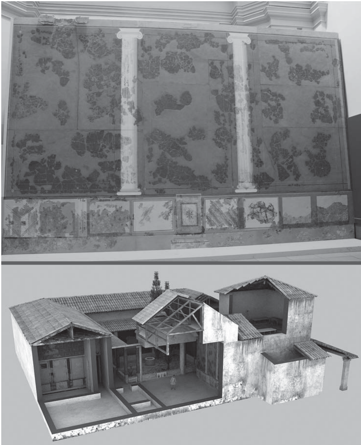
Fig. 3.- La casa de los Grifos como ejemplo de casa de peristilo: arriba, decoración pictórica del lienzo Oeste de la estancia E; abajo, hipótesis mostrando la restitución de volúmenes y decoraciones, desde el Norte.