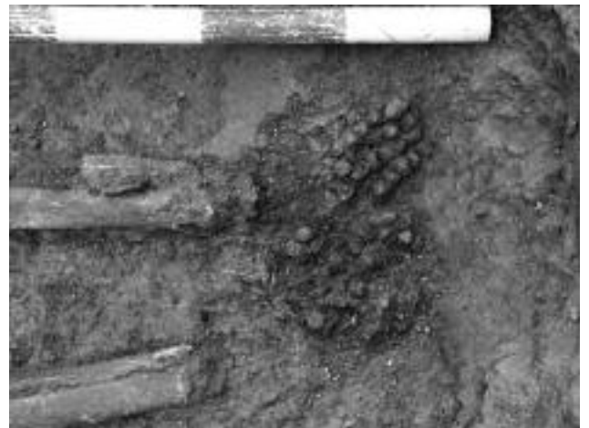
Lám. 5. Restos de calzado. Estructura 1100 de la Necrópolis de la c/ Gerona, nº 4, Móstoles

La mayoría de los estudios de estos materiales centran su análisis en cuestiones tipológicas, incluyendo con el término “ajuar” a todos los restos depositados en la tumba. No obstante, existe una importante diferenciación entre aquellos materiales que acompañan al difunto como parte de su indumentaria o adorno personal, de aquellos que se depositan en la tumba como expresión del deseo de acompañar y servir en el eterno descanso del individuo (Ciurana, 2011: 340). En este aspecto es importante resaltar que, a diferencia de lo que ocurre en otros momentos históricos no demasiado alejados en el tiempo, los enterramientos bajoimperiales no presentan indicios de un vestido excesivamente ornamentado, ya que los broches de cinturón, fibulas, botones, etc... son prácticamente inexistentes. Destaca en este aspecto del vestido, el hallazgo de restos de calzado en un significativo número de enterramientos. También los elementos de adorno personal –anillos fundamentalmente, pulseras y cuentas de collar– son escasos en el conjunto de los enterramientos.