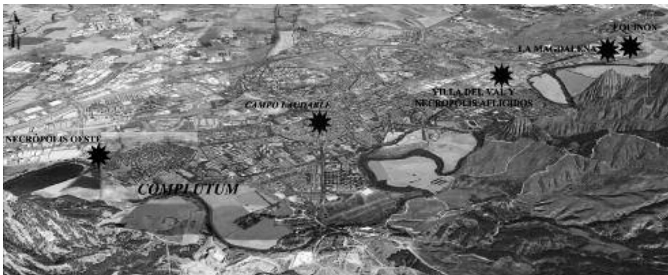
Fig 2. Dispersión de necrópolis perirurbanas en relación a Complutum

La eclosión de estudios sobre los momentos posteriores al Bajo Imperio que ha tenido lugar en el centro peninsular durante las últimas décadas, no ha tenido desarrollo paralelo en la investigación sobre este territorio en época romana. Son pocos los yacimientos conocidos y publicados completamente, aunque el incremento de las intervenciones de "salvamento" vinculadas al auge de los proyectos urbanísticos de los últimos decenios ha sacado a la luz un importante volu-