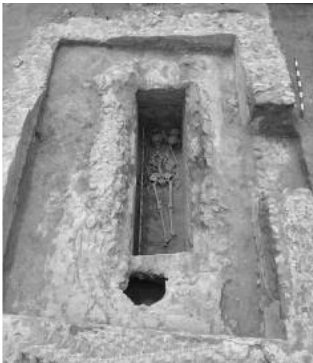
Lám. 3. Vista del Mausoleo de la necrópolis de Arroyomolinos

Otro tipo de monumentalización de las sepulturas y, por tanto, de realce de la posición del difunto en su última residencia es el revestimiento con tejas, bien en las paredes o, fundamentalmente, en la cubierta de la tumba.