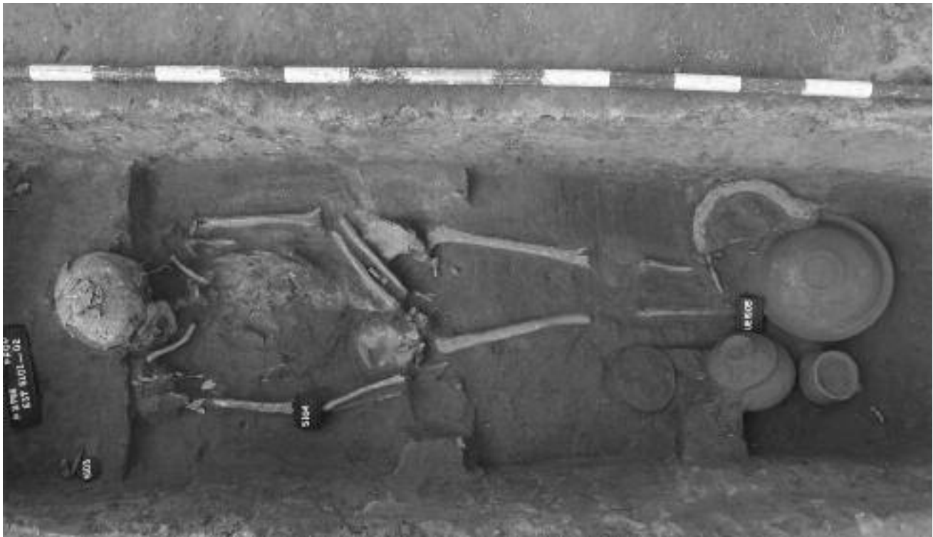
Lám. 6. Enterramiento con ajuar. Tumba 5100 de la Necrópolis de “La Magdalena”

El hallazgo de clavos en la mayoría de los enterramientos nos indica que los difuntos eran depositados en la tumba dentro de un ataúd o sobre un catafalco de madera. Sólo los más importantes marcaban su diferencia por medio de un sarcófago. Dichos sarcófagos eran una magnificación del propio ataúd de madera que, en muchos casos, se disponía dentro del sarcófago. En la zona de estudio se han encontrado los restos de dos sarcófagos de plomo en la necrópolis de El Jardín; sarcófagos que debieron albergar, según los excavadores (Vigil-Escalera et alii , 2009: 96), personajes importantes, relacionados con la hacienda agropecuaria que se encuentra en sus cercanías y que supusieron el germen de la necrópolis que se desarrolla después en las cercanías de los mausoleos.