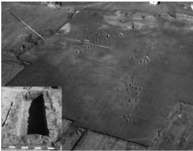
Lám. 2. Vista aérea y detalle de tumba con revestimiento interior de opus caementicium . Necrópolis de Las Zorreras, Yunquera de Henares, Guadalajara

vantes, y salpicada de silos y pequeños elementos asociados con la producción artesanal y agropecuaria del enclave. Se documentan un conjunto de tumbas de inhumación dispuestas según un eje lineal de dirección E-O sin apenas elementos constructivos que puedan establecer diferencias entre unas tumbas y otras, a excepción de los contenidos de ajuar, en el caso de tenerlo. Los excavadores resaltan la existencia de dos fases, basándose en el cambio de orientación de las fosas –N-S, las más antiguas y E-O las más modernas–.