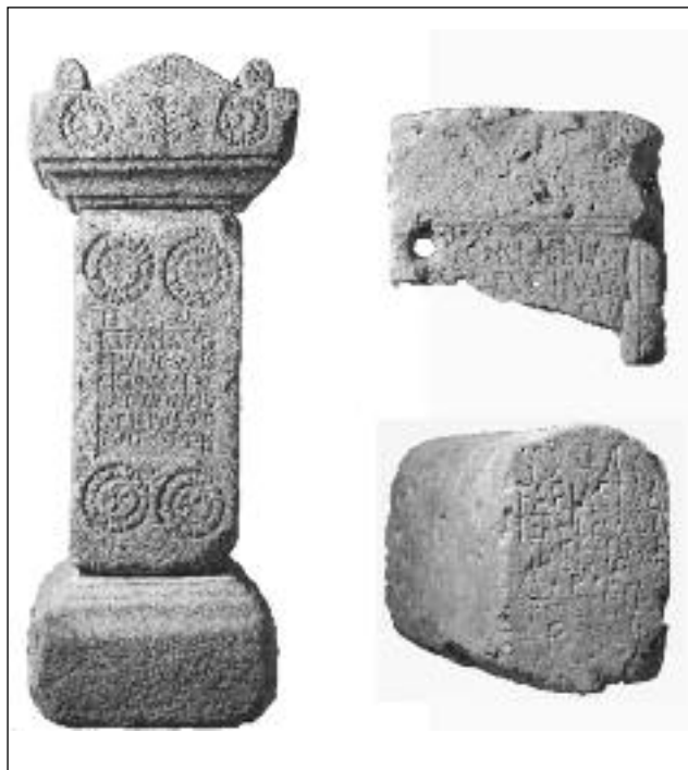
Lám 1. Monumentos epigráficos funerarios: ara, estela y cuppa

En el caso de los monumentos funerarios epigráficos, la falta de contextualización de la casi totalidad de los mismos sólo nos permite referirnos a ellos en el marco de una amplia escala de análisis, más relacionada con la interpretación del mundo de la muerte en el territorio que en el ámbito de los propios asentamientos. Un alto porcentaje de las inscripciones funerarias localizadas en la zona de estudio fueron halladas en las proximidades de la ciudad de Complutum y su distribución parece seguir la alineación de las antiguas calzadas existentes en la zona. Uno de los puntos más interesantes, aparte de su dispersión por todo el territorio complutense es la cronología de estos monumentos. Los datos obtenidos del análisis de los elementos externos e internos de las inscripciones fechan la mayor parte de ellas hacia el siglo II d. C., con algunos ejemplares que podrían pertenecer al siglo I d. C. y muy pocos que podrían extenderse hasta mediados del siglo III d. C. No hay, prácticamente, inscripciones funerarias que se puedan adscribir a cronologías bajoimperiales en el territorio que estamos analizando (Ruiz Trapero, 2001: 40).