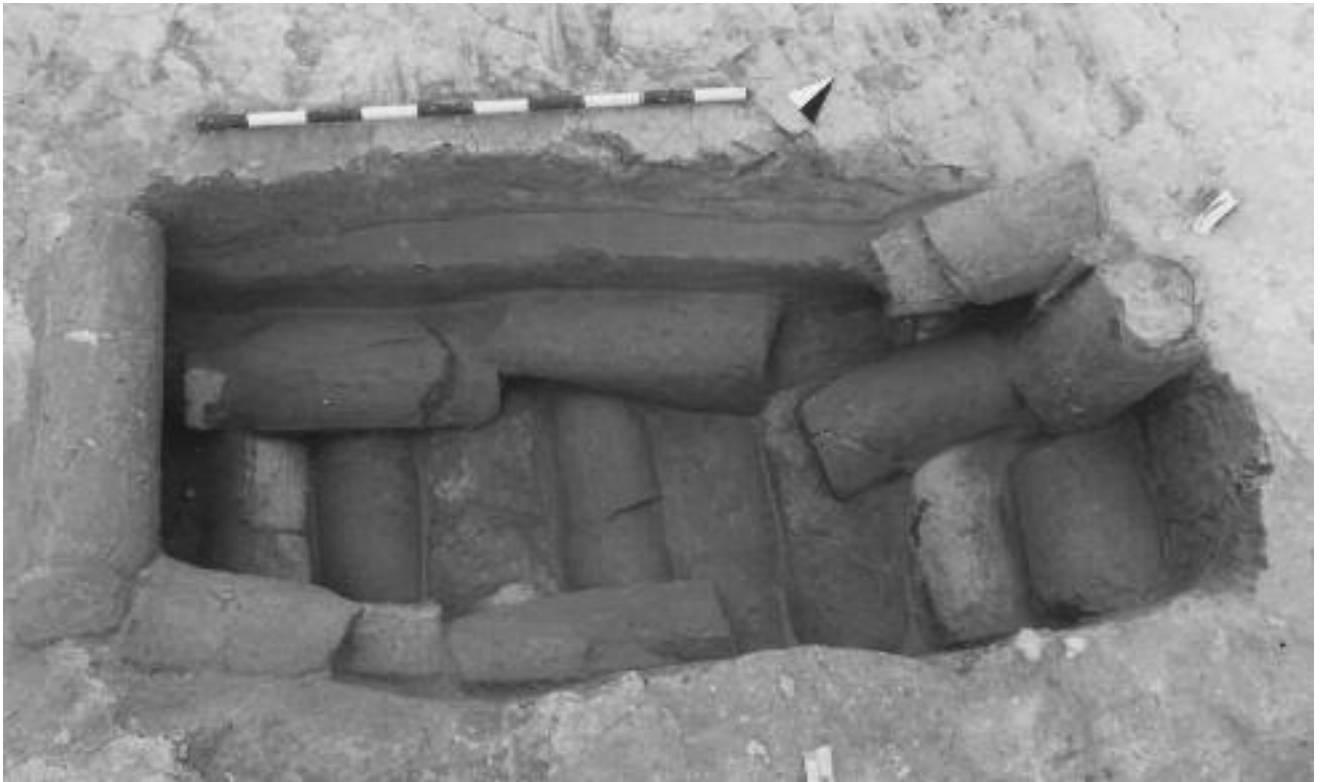
Lam. 7. Detalle estructura de libación. Tumba 14600 de la Necrópolis Occidental de Complutum